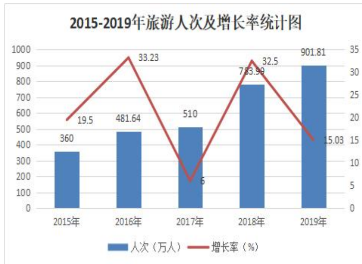
图 1-1 2015-2019 年旅游人次及增长率统计图