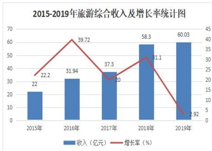
图 1-2 2015-2019 年旅游综合收入及增长率统计图